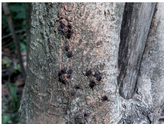
Figura 3. Agrupación de individuos de H. lusitanicum sobre tronco de árbol en Badalona a unos 50 cm del suelo. Foto: Carlos Pradera, 07-2022.

res. Normalmente, se encuentran enterradas en los terrenos en los que se encuentran sus hospedadores y, al percibir la proximidad de un hospedador, corren hacia el mismo. Sin embargo, no se activan todas simultáneamente, por lo que incluso la captura manual de los ejemplares visibles no arroja una medida adecuada de su densidad. Es por ello que los muestreos pretenden simplemente conocer las zonas en las que existe.