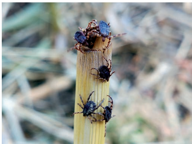
Figura 2. Individuos de H. lusitanicum en Badalona. Foto: Carlos Pradera, 07-2022.