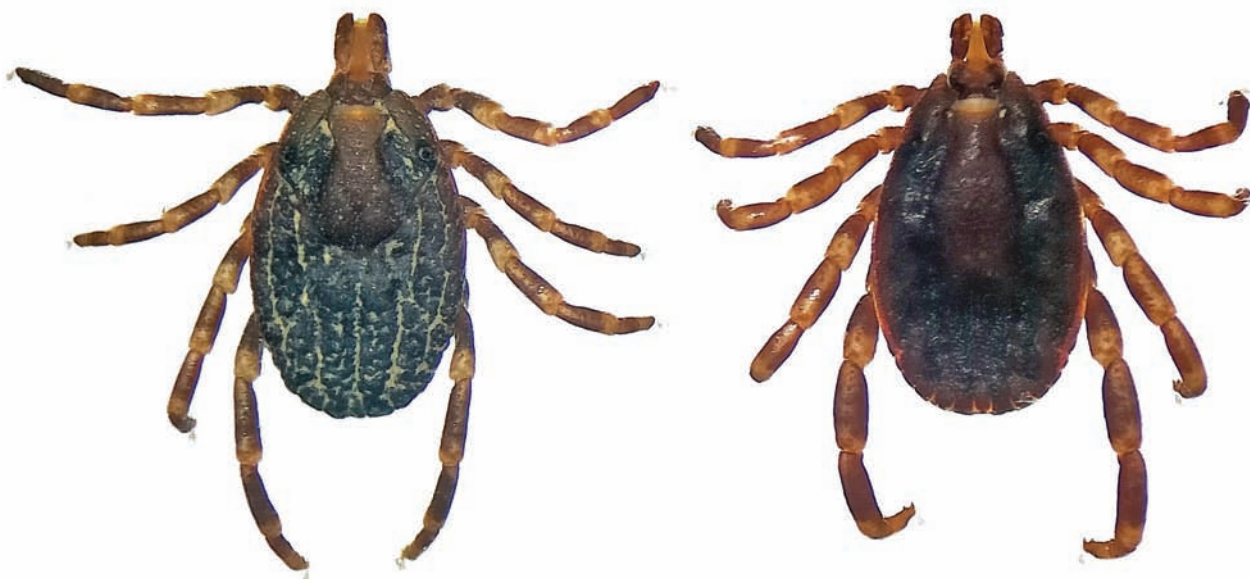
Figura 1. Hembra y macho de H. lusitanicum . Foto: Carlos Pradera, 09-2022.

No existe un estudio pormenorizado sobre la distribución de Hyalomma en Cataluña. Se conoce su presencia en el área de Barcelona a partir de los datos de Castillo-Contreras et al. (2022) sobre garrapatas en jabalí, Sus scrofa Linnaeus, 1758. El dato más antiguo al que hemos podido acceder es una imagen publicada en mayo de 2010 en «Biodiversidad Virtual» donde consta en el Parque Natural del Garraf ( https://www.biodiversidadvirtual.org/insectarium/Hyalomma-sp.-img124008.html ). Los datos de Castillo-Contreras et al. (2020) se refieren a garrapatas recolectadas en jabalí entre 2014 y 2016 en el Parque de Collserola, el municipio de Barcelona y el Campus de la Universidad Autónoma de Barcelona. Los resultados de estos autores señalan la recolección de 2.256 garrapatas de cuatro especies: H. lusitanicum (51,2 %), Rhipicephalus sanguineus Latreille, 1806 s.l. (24,7 %), Dermacentor marginatus Sulzer, 1776 (24 %) y Rhipicephalus bursa Canestrini & Fanzago, 1878 (0,04 %) sobre 261 jabalíes de 438 ejemplares examinados. Por nuestra parte, en junio de 2013 capturamos 6 individuos de H. lusitanicum en la zona sur de la Serralada de Marina, en Santa Coloma de Gra-